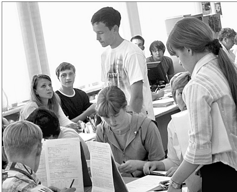
Третина школярів не довіряє тестам, хоча готується до них ретельно

Тестування набирає обертів. Так, 2006 року зовнішнє оцінювання пройшли 41 тис. (8%) одинадцятикласників, нинішнього — 116 тис. (26%). А 2008-го тестуванням планують охопити 530 тис. учасників, серед яких — випускники шкіл, ПТУ, вузів I-II рівнів акредитації, а також ви-